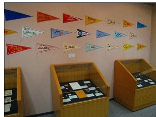
ペナントなどならば展示室

人形を探したりする遊びも展示スペースに盛り込まれていますので、気軽にご覧下さい。6月10日までとなっています。