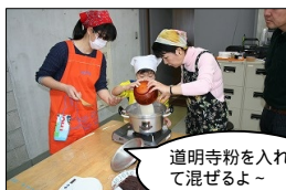
道明寺粉を入れて混ぜるよ～

ふぁみりーでいみゅーじあむで、鍋ひとつで作ることができる桜もち作りをしました。鍋に、砂糖・水・食紅を入れて沸騰させ、道明寺粉を加えます。ここで、素早くかきまぜ、火を止め20分寝かせます。その後軽く混ぜて粘りを出すのですが、寝かせた道明寺粉は、ずしっと重い...！でも、いっしょうけんめい混ぜてくれました。俵型にして、中にあんを包んで出来上がりです。春らしい、淡い桜色がきれいでした。桜もちはもっと時間のかかる、ちょっと大変そうなイメージがあっただけに、この作り方にはびっくりしました。