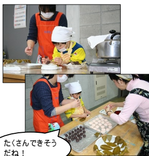
たくさんできそうだね！