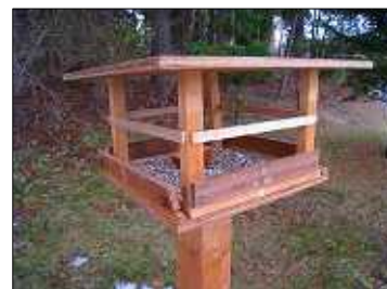
設置したバードテーブル

歴史館のそばに、バードテーブルを設置しました。ロビーや学習室から見える位置にあり、双眼鏡も設置していますので、ご自由に観察して頂きたいと思えます。ちなみに、去年はアカゲラやミヤマホオジロが飛来しましたが、さて、今年はどんな野鳥が来るのかな。