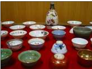
おちよこも展示しています

12月19日から来年2月12日まで、当館企画展示室において、企画展「器」を開催しております。縄文土器から陶磁器・漆器・竹細工まで、多様な材料で作られた「器」を集めました。芸術品とまではいかない日用品がほとんどですが、器に描かれた模様や形など、じっくりと見ていただければ幸いです。